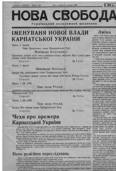
Щоденник Карпатської України «Нова свобода»

На жаль, недосвідченість Г. Жатковича як політика призвела до того, що договір про умови приєднання Закарпаття до Чехословаччини не було укладено письмово. Цей діяч мав необмежене довір'я до Т. Масарика та Е. Бенеша й вірив їм на слово. Але згодом мусив визнати, що «чехи нас обманули».