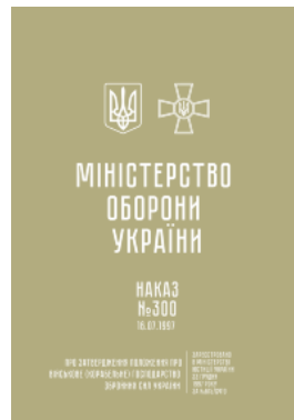
Наказ МОУ № 300 — Положення про військове (корабельне) господарство ЗСУ