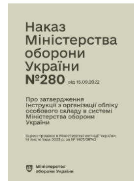
Наказ МОУ № 280 — Інструкція з організації обліку особового складу в системі МОУ