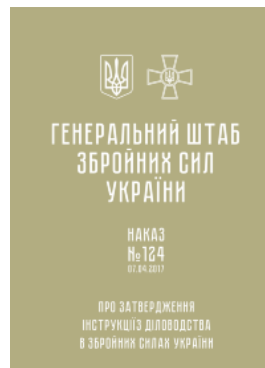
Наказ ГШ ЗСУ № 124 — Інструкція з діловодства у Збройних Силах України (2017 рік)