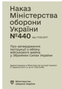
Наказ МОУ № 440 — Інструкція з обліку військового майна у ЗСУ