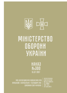
Наказ МОУ № 300 — Положення про військове (корабельне) господарство ЗСУ