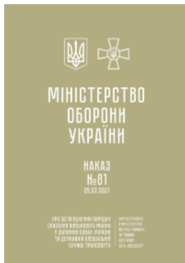
Наказ МОУ № 81 — Порядок списання військового майна у ЗСУ та ДССТ