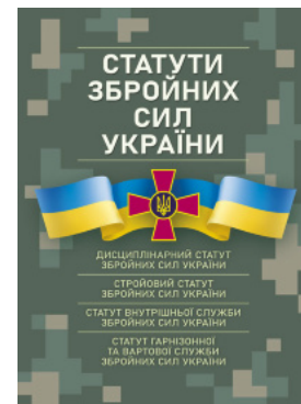
Статути збройних сил України