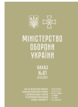
Наказ МОУ № 81 — Порядок списання військового майна у ЗСУ та ДССТ