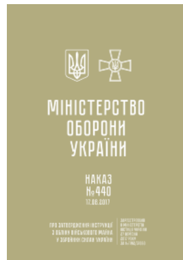
Наказ МОУ № 440 — Інструкція з обліку військового майна у ЗСУ