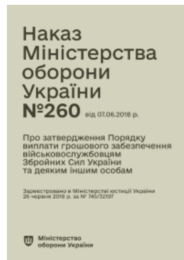
Наказ МОУ № 260 — Порядок виплати грошового забезпечення військовослужбовцям ЗСУ та деяким іншим особам