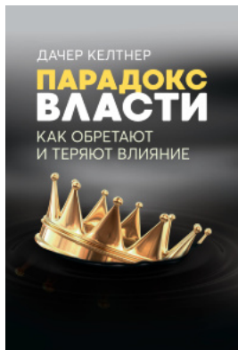
Парадокс власти. Как обретают и теряют влияние