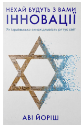
Нехай будуть з вами інновації. Як ізраїльська винахідливість рятує світ