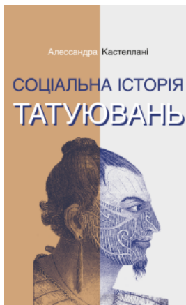
Соціальна історія татуювань