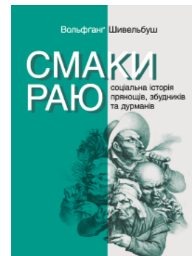
Смаки раю. Соціальна історія прянощів, збудників та дурманів