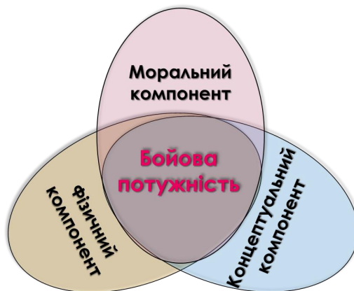
Рис. 1.1. Компоненти бойової потужності військ (сил)

і штабами НАТО. Доктрина містить корисну інформацію для країн – членів НАТО, партнерів і країн, що не є його членами.