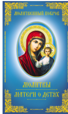
Молитвенный покров. Молитвы матери о детях