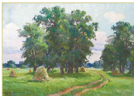
В. Непійпиво. «Серпень»

Подивись, як художники зображують літо. Які кольори використали митці у своїх творах?