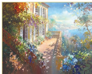
Л. Парсельє. Пейзаж