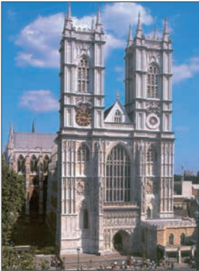
Вестмінстерське абатство. 1245–1745 рр. Лондон

Розгляньте ілюстрації. Які види мистецтва на них зображено? Обґрунтуйте свою думку.