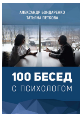
100 бесед с психологом (рос.)