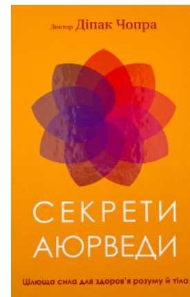
Секрети аюрведи. Цілюща сила для здоров'я розуму й тіла