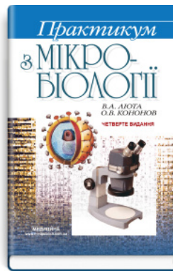
Практикум з мікробіології: навчальний посібник