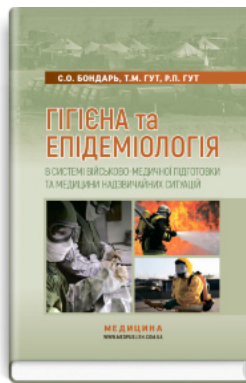
Гігієна та епідеміологія в системі військово-медичної підготовки та медицини надзвичайних ситуацій: підручник (ВНЗ I—III р. а.)