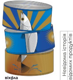
Зоологічна екскурсія супермаркетом. Невідома історія відомих продуктів

Леонід Горобець Зоологічна екскурсія супермаркетом