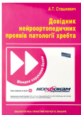
Довідник нейроортопедичних проявів патології хребта