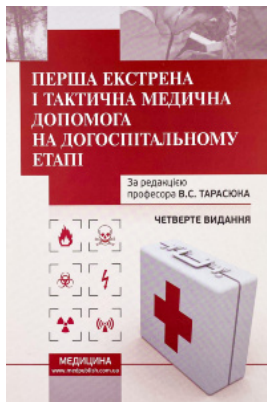
Перша екстрена і тактична медична допомога на догоспідальному етапі