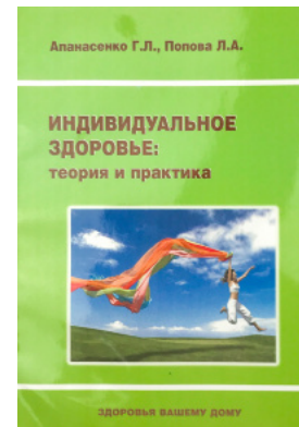
Індивідуальне здоров'я: теорія і практика