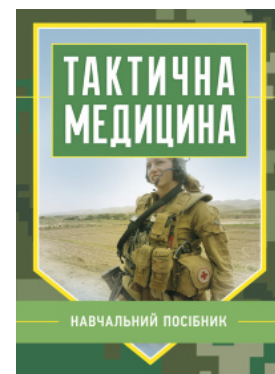
Тактична медицина. Навчальний посібник

Перейти до категорії Охорона здоров'я. Гігієна