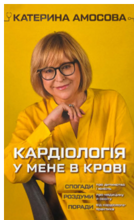
Кардіологія у мене в крові