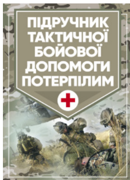
Підручник тактичної бойової допомоги потерпілим