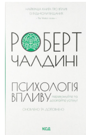
Психологія впливу. Оновлено та доповнено