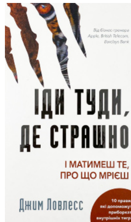
Іди туди, де страшно. І матимеш те, про що мрієш