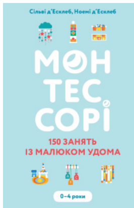
Монтессорі. 150 занять із малюком удома. 0-4 роки