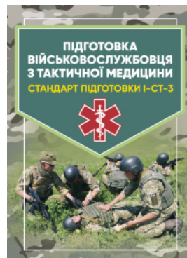
Підготовка військовослужбовця з тактичної медицини. Стандарт підготовки І-СТ-3