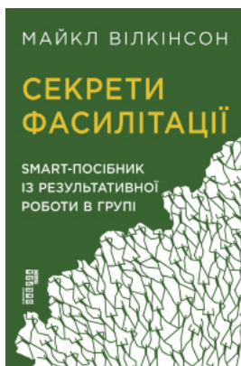
Секрети фасилітації. SMART-посібник із результативної роботи в групі