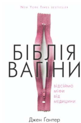
Біблія вагіни. Відсіймо міфи від медицини!