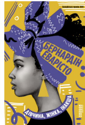
Дівчина, жінка, інакша