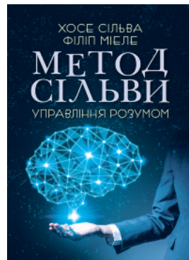
Метод Сільви. Управління розумом