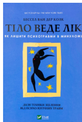
Тіло веде лік. Як лишити психотравми в минулому