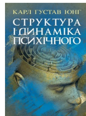
Структура і динаміка психічного