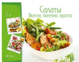
Салаты. Вкусно, полезно, просто