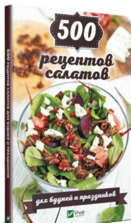
500 рецептов салатов для будней и праздников