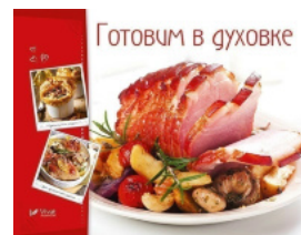
Готовим в духовке