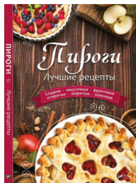
Пироги Лучшие рецепты