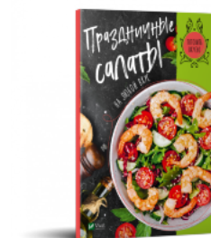
Праздничные салаты на любой вкус