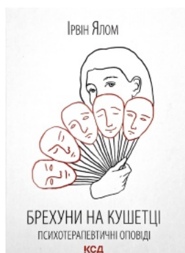
Брехуни на кушетці. Психотерапевтичні оповіді