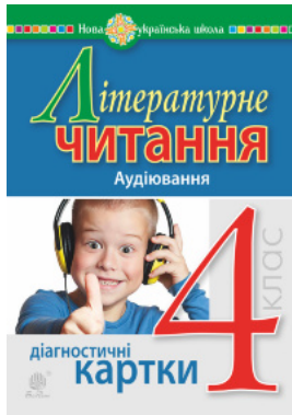
Літературне читання. 4 клас. Аудіювання. Діагностичні картки. НУШ