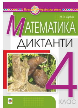
Математика. 4 клас. Диктанти. НУШ

Перейти до категорії Навчальна література