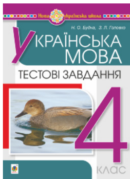
Українська мова. 4 клас. Тестові завдання. НУШ