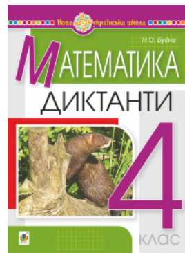
Математика. 4 клас. Диктанти. НУШ

Перейти до категорії Навчальна література