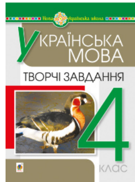
Українська мова. 4 клас. Творчі завдання. НУШ