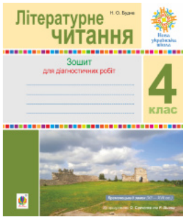
Літературне читання. 4 клас. Діагностичні роботи. НУШ