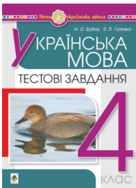
Українська мова. 4 клас. Тестові завдання. НУШ