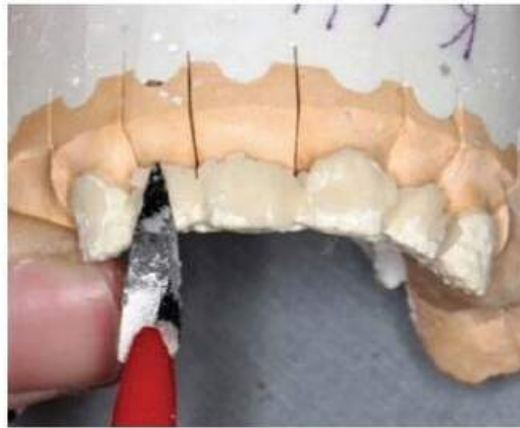
Мал. 465. Моделювання вестибулярної поверхні опорних зубів пластмасовою масою