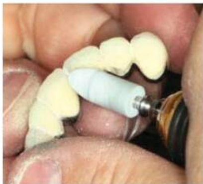
Мал. 470. Оброблення піднебінної поверхні металопластмасового мостоподібного протеза