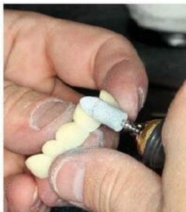
Мал. 469. Оброблення вестибулярної поверхні металопластмасового протеза шліфувальними головками