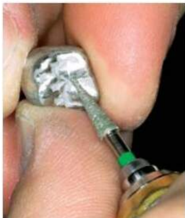
Мал. 459. Оброблення опорного зуба від пакувальної маси