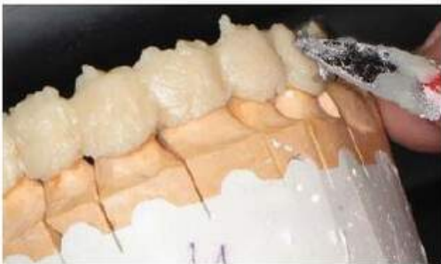
Мал. 466. Моделювання міжзубних проміжків та пришийкової ділянки