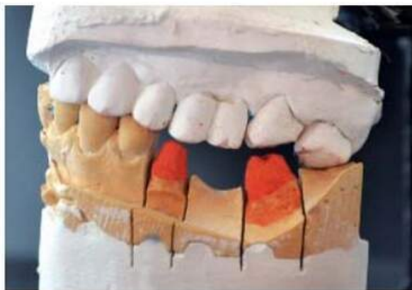
Мал. 440. Гіпсові моделі, зафіксовані в артикуляторі