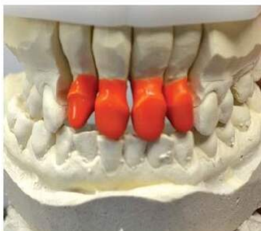
Мал. 482. Вигляд гіпсових опорних зубів після занурення їх у занурювальний віск