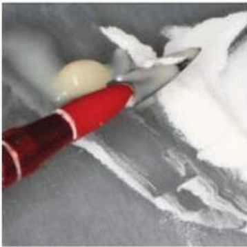
Мал. 464. Нанесення маскувального шару на поверхню металевго каркаса