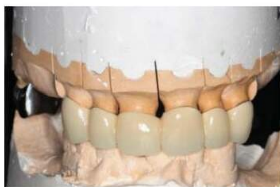
Мал. 475. Вигляд готового метало-пластмасового протеза з вестибулярної поверхні