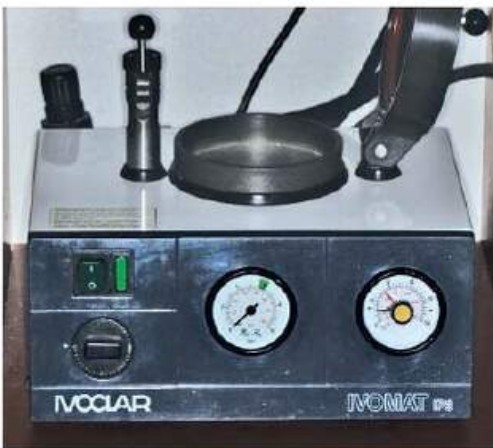
Мал. 468. Полімеризація в апараті IVOCLAR під тиском 3–4 амп.