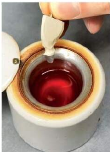
Мал. 479. Розплавлений занурювальний віск