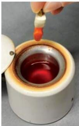
Мал. 481. Виведення гіпсового стовпчика зуба із занурювального воску