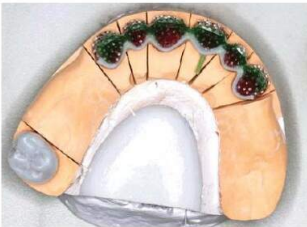
Мал. 456. Вигляд воскової композиції з нанесеним бісером