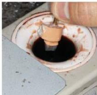
Мал. 449. Поступове занурення гіпсового зуба у занурювальний віск