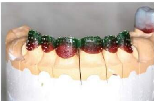
Мал. 458. Вигляд воскової композиції з вестибулярної поверхні