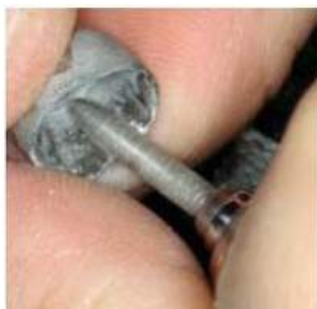
Мал. 461. Оброблення внутрішньої поверхні коронки опорного зуба