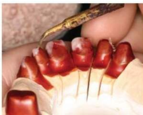
Мал. 453. Початок моделювання міжкоронкових просторів

Лобзик або алмазний диск для розрізання моделей