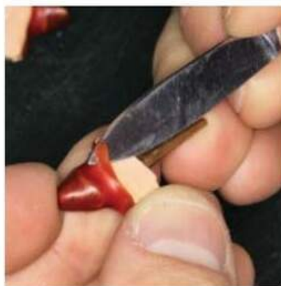
Мал. 451. Підрізання воску по контурах шийки зуба