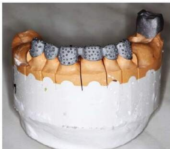
Мал. 462. Оброблений каркас металопластмасового мостоподібного протеза