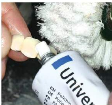
Мал. 472. Нанесення на поверхню опорних коронок полірувальної пасту