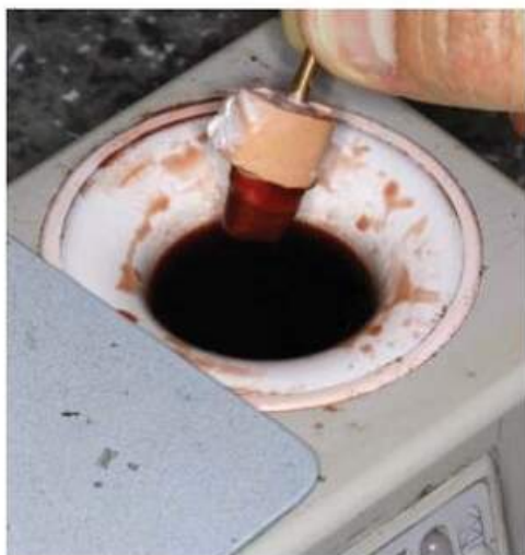
Мал. 450. Виведення гіпсового зуба із занурювального воску