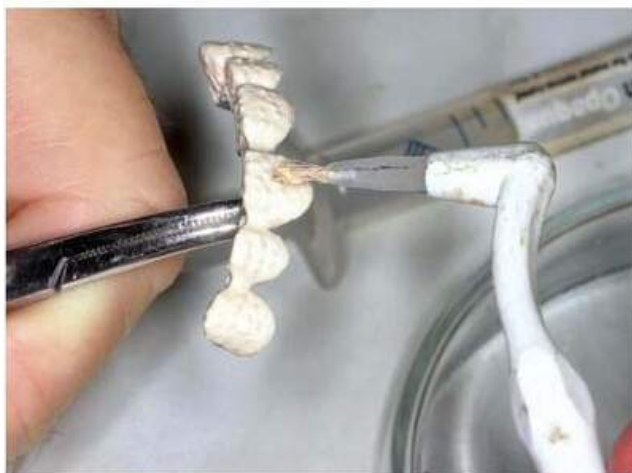
Мал. 463. Нанесення маскувального шару покривним лаком на вестибулярну поверхню