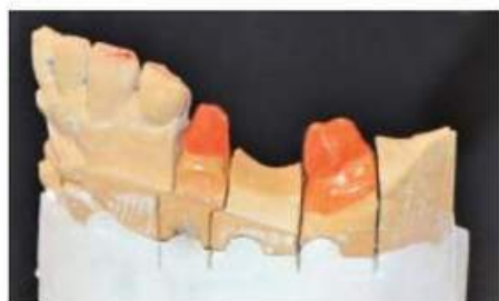
Мал. 441. Опорні зуби, покриті ізоляційним лаком