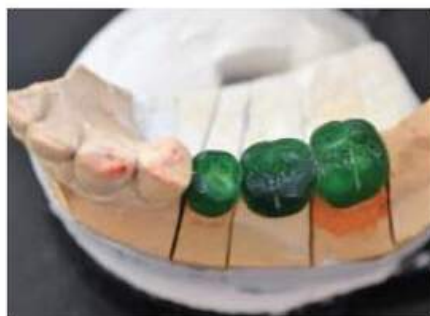
Мал. 442. Воскова композиція суцільнолитого мостоподібного протеза. Вигляд зверху