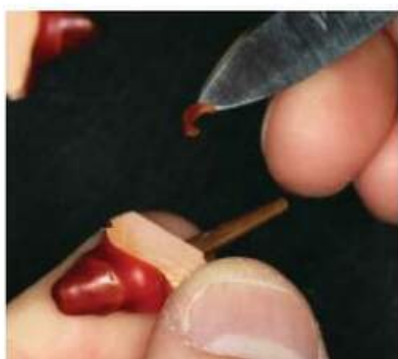
Мал. 452. Вигляд воскового ковпачка після підрізання по межах шийки зуба