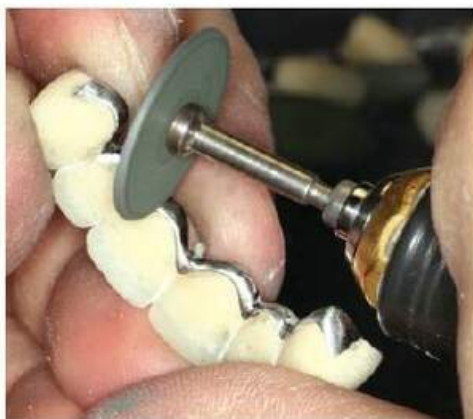
Мал. 471. Оброблення гумовим диском металевої гірлянди