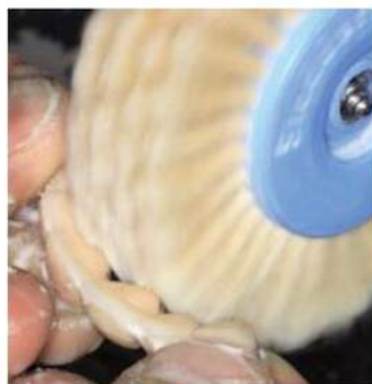
Мал. 473. Полірування піднебінної поверхні за допомогою шліфувальних щіток