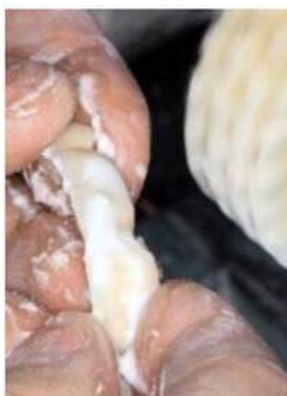
Мал. 474. Полірування вестибулярної поверхні