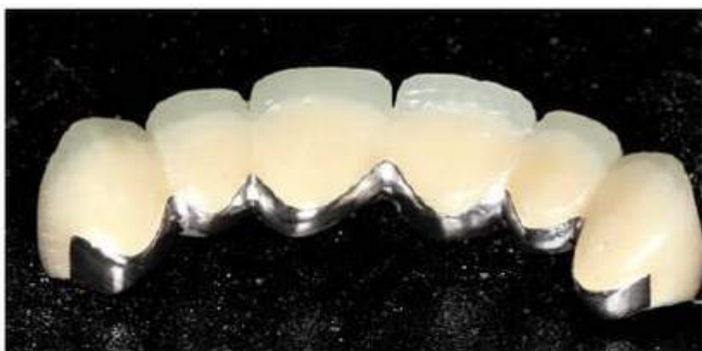
Мал. 476. Вигляд готового металопластмасового протеза з піднебінної поверхні