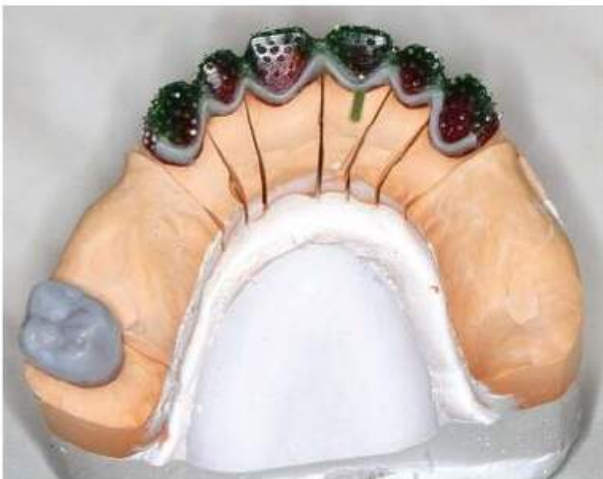
Мал. 457. Вигляд воскового штифта з язикової поверхні