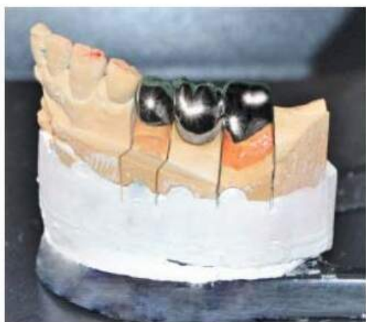
Мал. 445. Готовий суцільнолитий мосто-подібний протез на гіпсовій моделі, вигляд з вестибулярної поверхні

Пікосент лак розді- ловий Набір для нанесення ретенційних пунктів