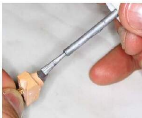
Мал. 447. Нанесення штумпф-лаку на апроксимальну поверхню опорного зуба