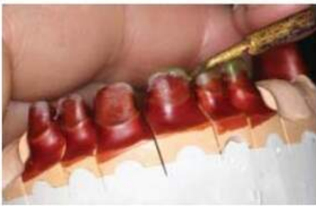
Мал. 454. Моделювання різальної поверхні воскової композиції