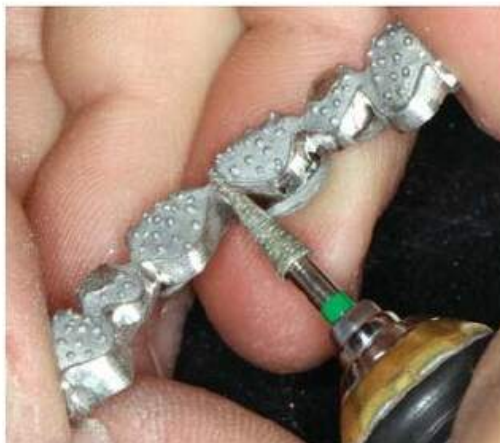
Мал. 460. Оброблення гірлянди каркаса металопластмасового мостоподібного протеза