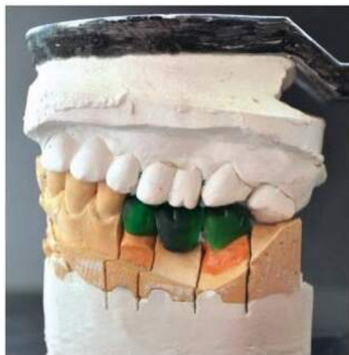
Мал. 443. Воскова композиція суцільнолитого мостоподібного протеза в оклюзійних контактах