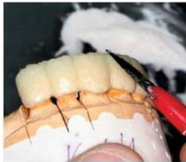
Мал. 467. Завершення моделювання анатомічної форми опорних зубів