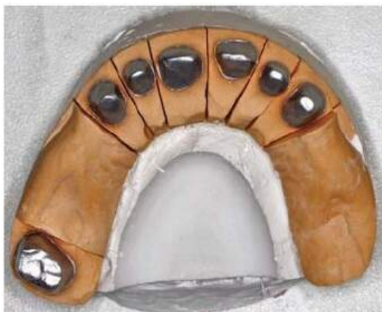
Мал. 448. Опорні зуби, покриті шаром шtumпф-лаку