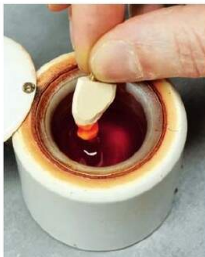
Мал. 480. Занурення гіпсового стовпчика в занурювальний віск