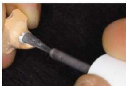
Мал. 446. Нанесення штумпф-лаку на вестибулярну поверхню опорного зуба