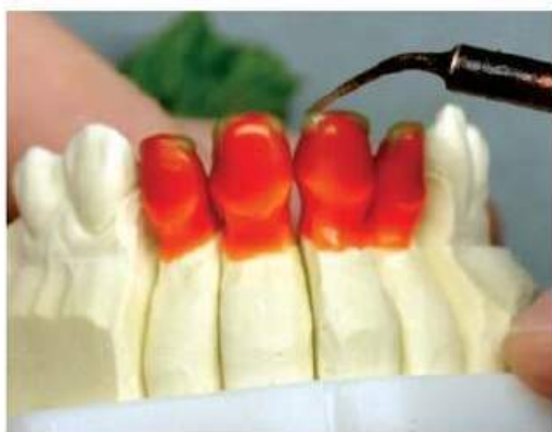
Мал. 483. Початок процесу моделювання воскової композиції металокерамічного протеза

Ливарна установка Піндекс-система Електрошпатель