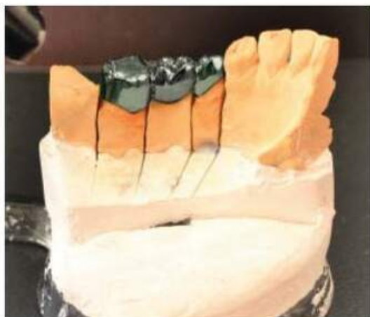
Мал. 444. Готовий суцільнолитий мосто-подібний протез на гіпсовій моделі, вигляд з язикової поверхні