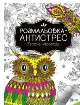
Розмальовка-антистрес с. Творча насолода