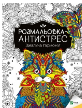
Розмальовка-антистрес с. Ідеальна гармонія