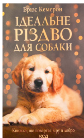
Ідеальне Різдво для собаки