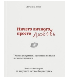
Ничего личного, просто любовь. Книга для умных, красивых женщин и смелых мужчин