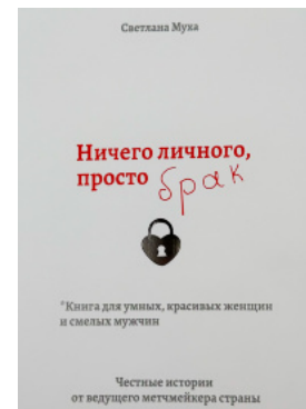
Ничего личного, просто Брак

Перейти до категорії Аналітична психологія