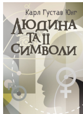
Людина та її символи