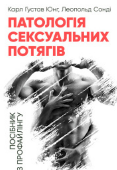
Патология сексуальных потягив. Посібник з профайлінгу