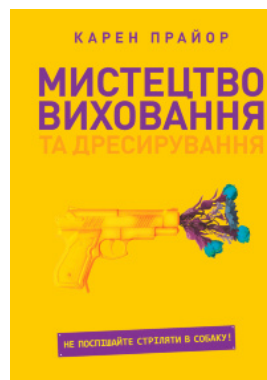
Мистецтво виховання та дресирування. Не поспішайте стріляти в собаку!