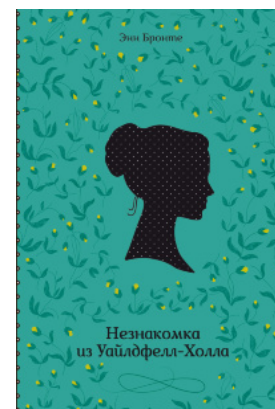
Незнакомка из Уайлдфелл-Холла