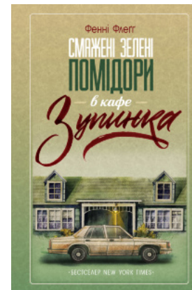
Смажені зелені помідори в кафе «Зупинка»