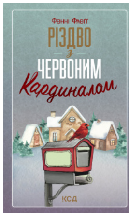
Різдво з червоним кардиналом