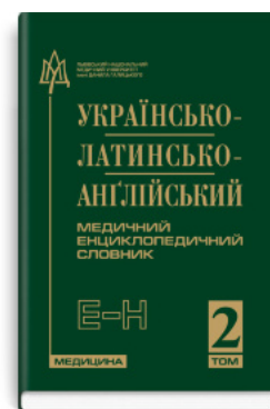
Українсько-латинсько-англійський медичний енциклопедичний словник: у 4 томах. — Том 2. Е—Н