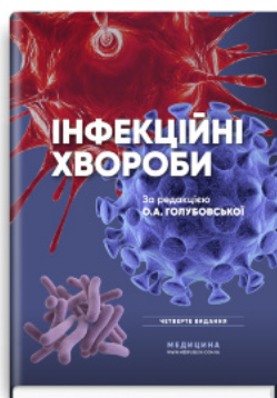
Інфекційні хвороби: підручник