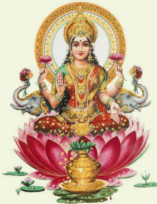
Падмини, или женщина-лотос, олицетворяла красоту в древнеиндийской литературе

Особую роль играют ганики 1 . Индусы всегда выделяли их в отдельную прослойку общества, и они заслуживали определенного уважения до тех пор, пока вели себя прилично и правильно. На Востоке к ним никогда не относились с такой жесткостью и презрением, как это случалось на Западе, хотя их образование всегда было на порядок выше по сравнению с обычными индийскими женщинами.