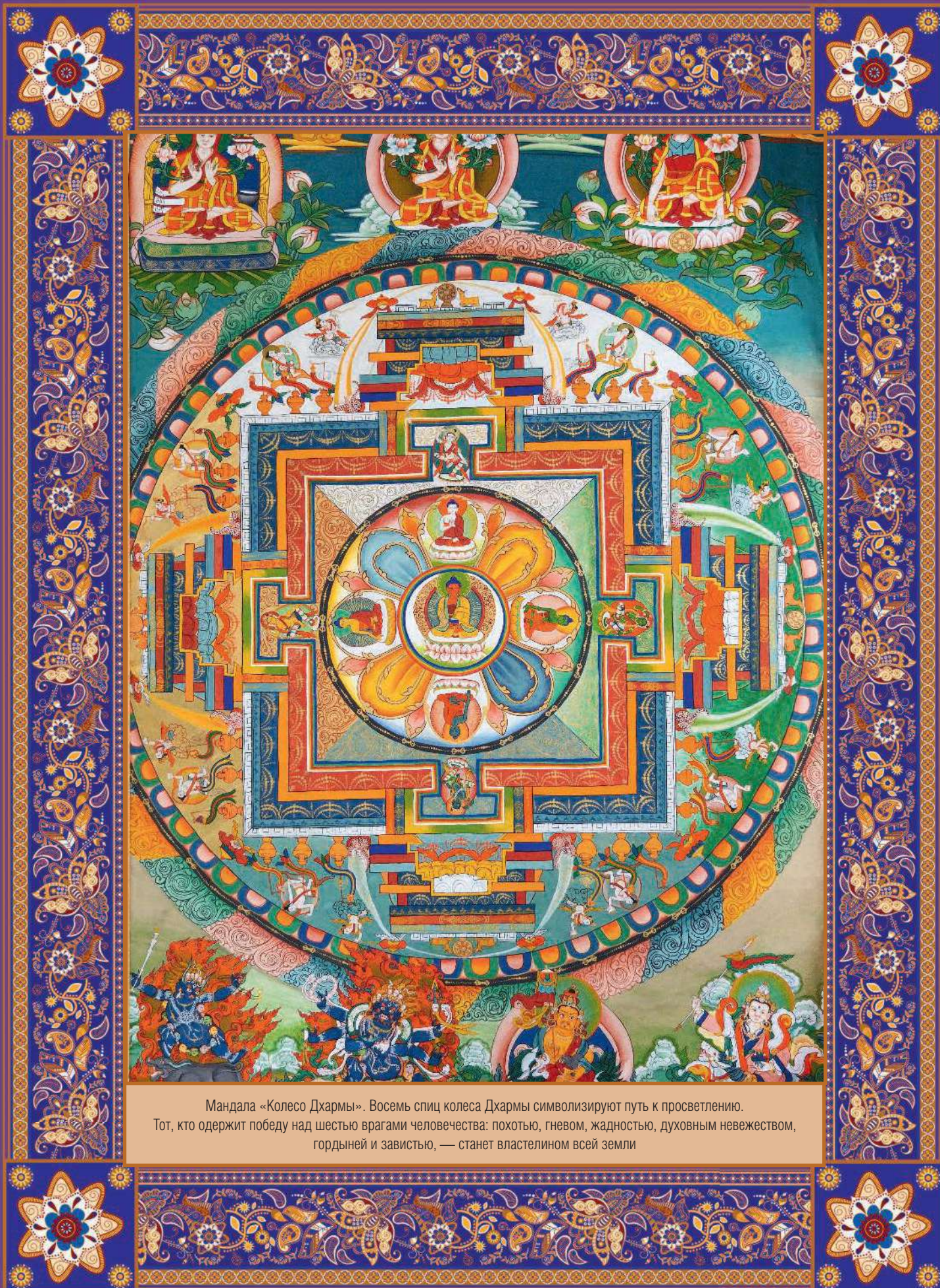
Мандава «Колесо Дхармы». Восемь спиц колеса Дхармы символизируют путь к просветлению. Тот, кто одержит победу над шестью врагами человечества: похотью, гневом, жадностью, духовным невежеством, гордыней и завистью, — станет властелином всей земли