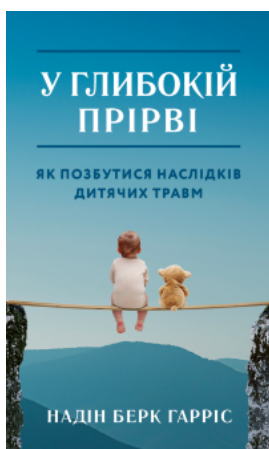
У глибокій прірві. Як позбутися наслідків дитячих травм