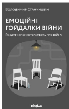
Емоційні гойдалки війни. Роздуми психотерапевта про війну