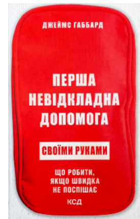
Перша невідкладна допомога своїми руками. Що робити якщо швидка не поспішає