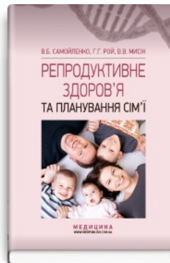
Репродуктивне здоров'я та планування сім'ї: підручник (ВНЗ I—III р. а.)