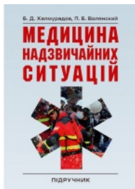
Медицина надзвичайних ситуацій