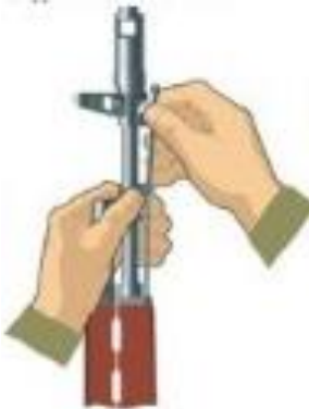
Рисунок 5 – від'єднання шомпола.

3. Від'єднати шомпол. Відтягнути кінець шомпола від ствола так, щоб його головка вийшла з-під упора на основі мушки (рисунок 5) і витягнути його. Якщо шомпол туго виходить, дозволяється користуватися виколоткою, яку слід вставити в отвір головки шомпола, відтягнути від ствола кінець шомпола і вийняти його.