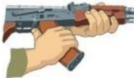
Рисунок 4 – від'єднання магазину автомата Калашнікова.

1. Від'єднати магазин. Утримуючи автомат (кулемет) лівою рукою за шийку прикладу або цівку правою рукою обхопити магазин (рисунок 4); натискаючи великим пальцем на застібку, подати нижню частину магазину вперед і відокремити його. Після цього перевірити: чи нема набою у набійнику, для чого опустити перевідник донизу, поставити його у положення “АВ” чи “ОД”; відвести ручку затворної рами назад, оглянути набійник, відпустити ручку затворної рами і спустити курок із бойового взведення.