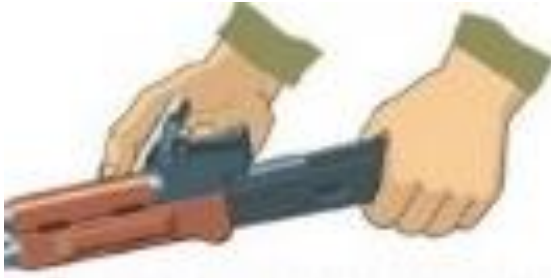
Рисунок 11 – від'єднати газову трубку із ствольною накладкою.