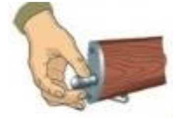
Рисунок 12 – вкладання пеналу належності до гнізда прикладу.

9. Вкласти пенал у гніздо приклада. скласти у пенал протирку, йоршик, викрутку і виколотку і зачинити його кришкою, вкласти пенал дном у гніздо приклада (рисунок 12) і утопити його так, щоб гніздо зачинилося кришкою. у автоматів із складним прикладом пенал вкладають у кишеню сумки для магазинів.