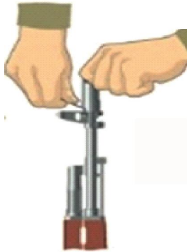
Рисунок 6 – від'єднання гальма-компенсатора (полум'ягасник у РПК).

5. Від'єднати кришку ствольної коробки. Лівою рукою обхопити шийку приклада, великим пальцем цієї руки натиснути на виступ направляючого стержня поворотального механізму, правою рукою припідняти вгору задню частину кришки ствольної коробки (рисунок 7) та від'єднати кришку.