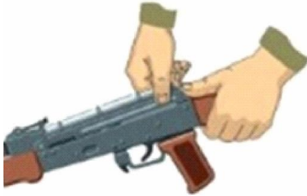
Рисунок 7 – від'єднання кришки ствольної коробки.

5. Від'єднати кришку ствольної коробки. Лівою рукою обхопити шийку приклада, великим пальцем цієї руки натиснути на виступ направляючого стержня поворотального механізму, правою рукою припідняти вгору задню частину кришки ствольної коробки (рисунок 7) та від'єднати кришку.