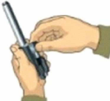
Рисунок 10 – від'єднання затвору від затворної рами.

8. Від'єднати затвор від затворної рами. Взяти затворну раму у ліву руку затвором догори (рисунок 10) і правою рукою відвести затвор назад, повернути його так, щоб ведучий виступ затвору вийшов із фігурного вирізу затворної рами і вивести затвор вперед.