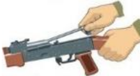
Рисунок 8 – від'єднання поворотального механізму.

6. Від'єднати поворотальний механізм. Утримуючи автомат (кулемет) лівою рукою за шийку приклада, правою подати вперед направляючий стержень поворотального механізму до виходу його п'ятки із повздовжнього пазу ствольної коробки; припідняти задній кінець направляючого стержня (рисунок 8) і вийняти поворотальний механізм з каналу затворної рами.