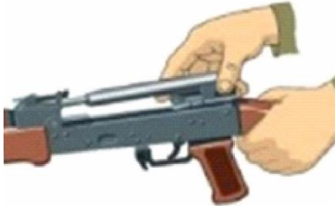
Рисунок 9 – від'єднання затворної рами із затвором.

7. Від'єднати затворну раму із затвором. Продовжуючи утримувати автомат (кулемет) лівою рукою, правою відвести затворну раму назад до відмови, припідняти її разом із затвором (рисунок 9) і від'єднати від ствольної коробки.