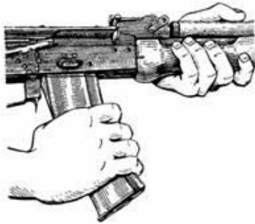
Рисунок 13 – приєднання магазину.

10. Приєднати магазин до автомата (кулемета). Утримуючи автомат (кулемет) лівою рукою за шийку приклада чи цівку, правою ввести у вікно ствольної коробки зачіп магазину (рисунок 13) і повернути магазин на себе так, щоб застібка зістрибнула за опорний виступ магазину.