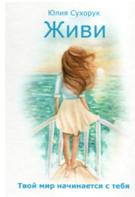
Живи. Твой мир начинается с тебя