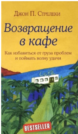
Возвращение в кафе. Как избавиться от груза проблем и поймать волну удачи