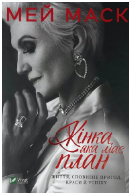
Жінка, яка має план. Життя, сповнене пригод, краси й успіху