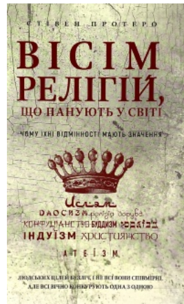
Вісім релігій, що панують у світі: чому їхні відмінності мають значення