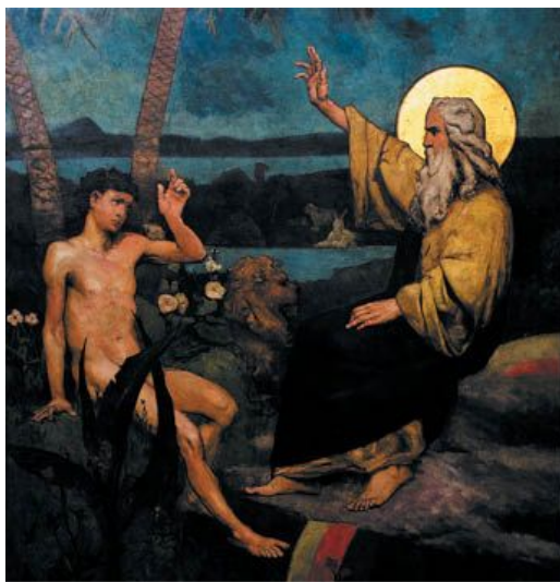
В. А. Котарбинский. Сотворение человека. Завет с Адамом. XIX в.

31 И увидел Бог все, что Он создал, и вот, хорошо весьма. И был вечер, и было утро: день шестый.