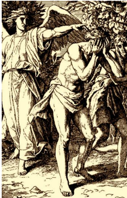
Юлиус Шнорр фон Карольсфельд. Изгнание из рая. XIX в. (фрагмент)

16 Жене сказал: умножая умножу скорбь твою в беременности твоей; в болезни будешь рожать детей; и к мужу твоему влечение твое, и он будет господствовать над тобою.