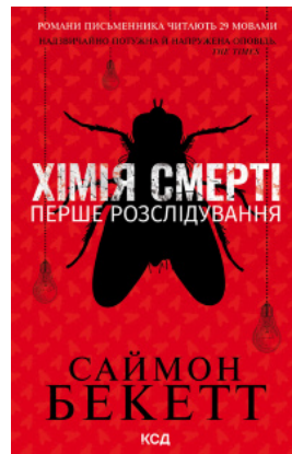
Хімія смерті. Перше розслідування