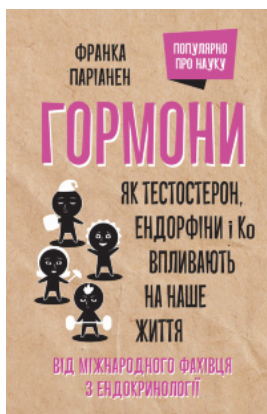
Гормони. Як тестостерон, ендорфіни і Ко впливають на наше життя