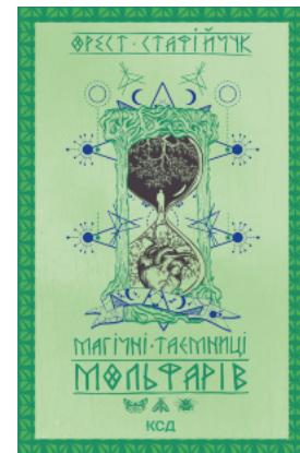
Магічні таємниці мольфарів