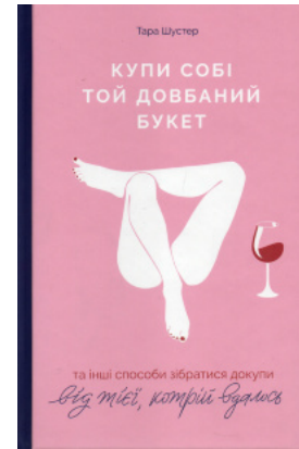
Купи собі той довбаний букет: та інші способи зібратися докупити від тієї, кому вдалось