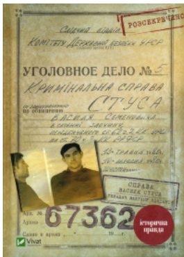
Справа Василя Стуса. Збірка документів з архіву колишнього КДБ УРСР