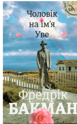
Чоловік на ім'я Уве