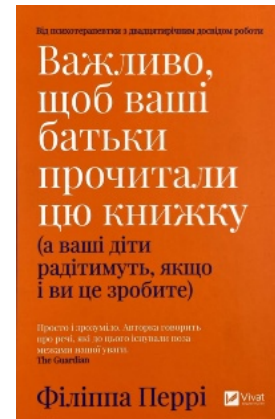
Важливо, щоб ваші батьки прочитали цю книжку (а ваші діти радітимуть, якщо і ви це зробите)