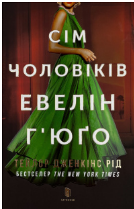
Сім чоловіків Евелін Г'юго