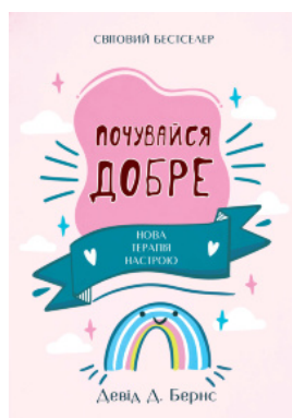
Почувайся добре. Нова терапія настрою