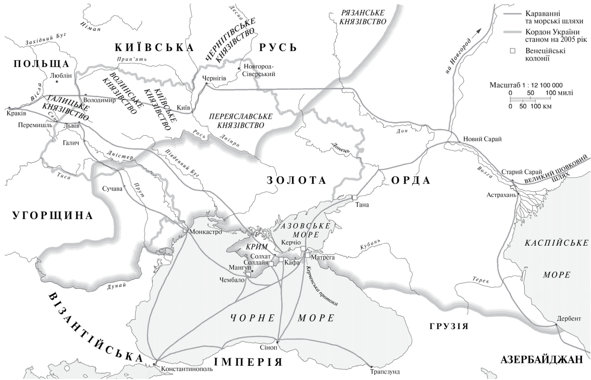
Рис. 4. Золота Орда близько 1300 р.