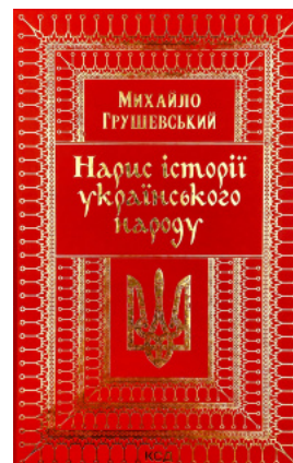
Нарис історії українського народу