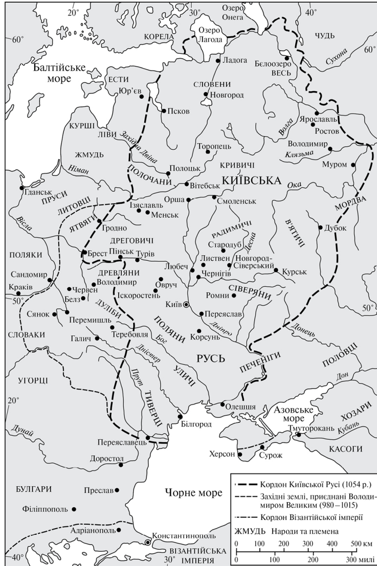
Рис. 2. Київська Русь у 980—1054 рр.