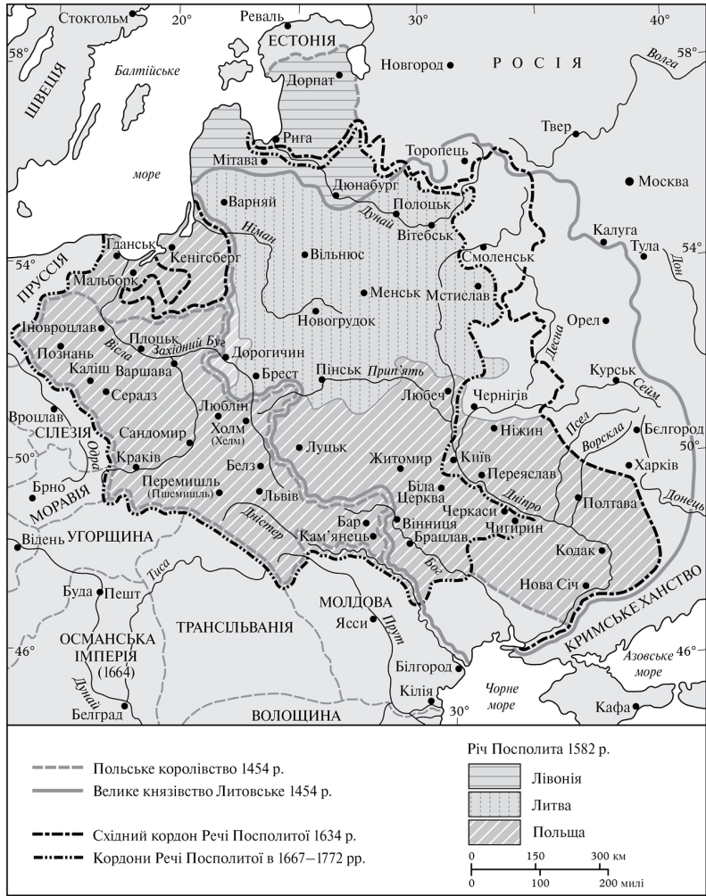
Рис. 5. Землі Речі Посполитої в XVI—XVIII ст.