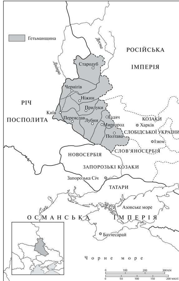
Рис. 7. Гетьманщина та навколишні території в 1750-х рр.

Джерело: Zenon E. Kohut, Russian Centralism and Ukrainian Autonomy: Imperial Absorption of the Hetmanate, 1760s—1830s (Cambridge, MA: Harvard University Press, 1988), p. xiv.