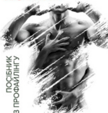
Патологія сексуальних потягів. Посібник з профайлінгу