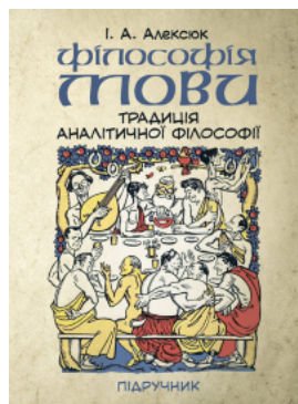
Філософія мови: традиція аналітичної філософії