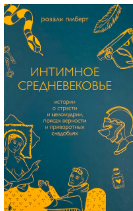
Интимное Средневековье. Истории о страсти и целомудрии, поясах верности и приворотных снадобьях