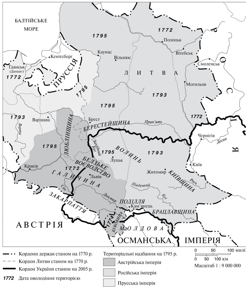
Рис. 8. Поділи Польщі