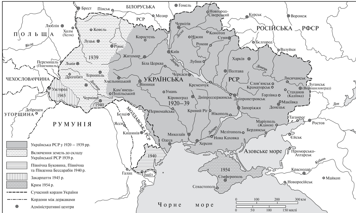
Рис. 9. Радянська Україна