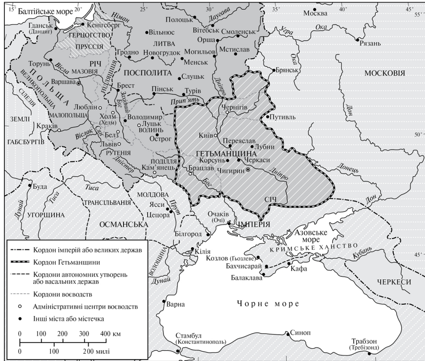
Рис. 6. Козацька Україна близько 1650 р.