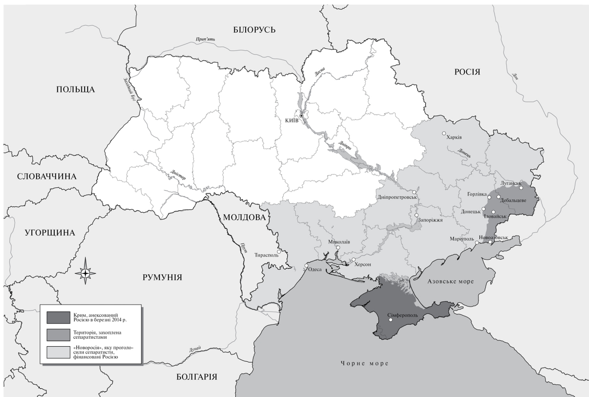
Рис. 10. Російсько-український конфлікт