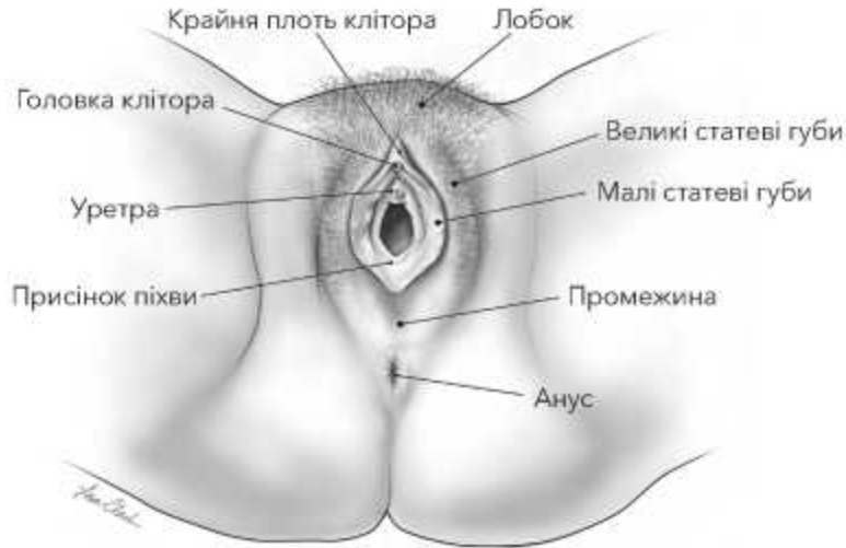
Рис. 1: Вульва. Ілюстрація Лізи А. Кларк, Clark Medical Illustration.