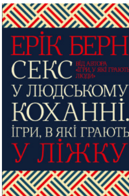
Секс у людському коханні. Ігри, в які грають у ліжку