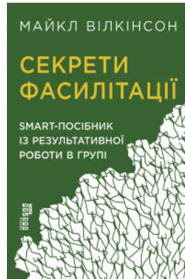
Секрети фасилітації. SMART-посібник із результативної роботи в групі