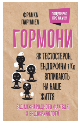
Гормони. Як тестостерон, ендорфіни і Ко впливають на наше життя