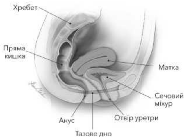
Рис. 4: Тазове дно жінки (сагітальний розріз). Ілюстрація Лізи А. Кларк, Clark Medical Illustration.

Слабкість або розрив тазового дна, найчастіше зумовлені пологами, можуть спричинити нетримання сечі чи калу, опущення чи випадання органів малого тазу. Якщо ж м'язи тазового дна стають занадто щільними, спазм, який виникає як наслідок цього, може призвести до болю під час сексу.