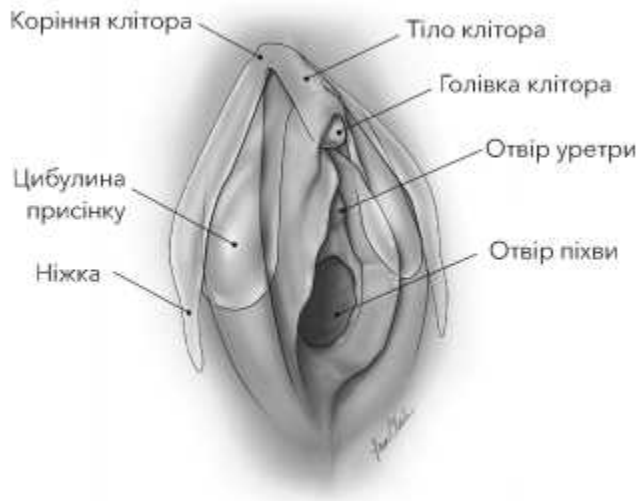
Рис. 2 Анатомія клітора. Ілюстрація Лізи А. Кларк, Clark Medical Illustration

Оскільки клітор так близький із уретрою та нижніми стінками піхви, фахівці вважають доречнішим термін клітороуретровагінальний комплекс .