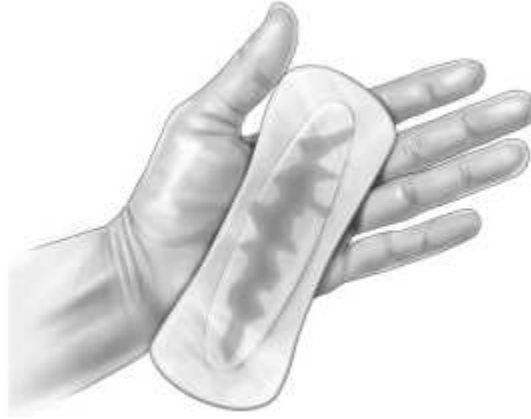
Рис. 5: Рука, що тримає прокладку із виділеннями. Ілюстрація Лізи А. Кларк, Clark Medical Illustration.