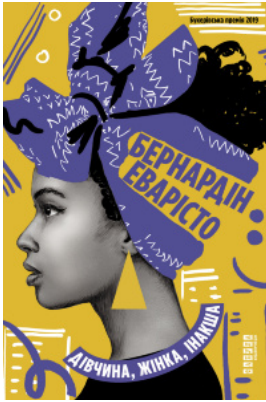
Дівчина, жінка, інакша