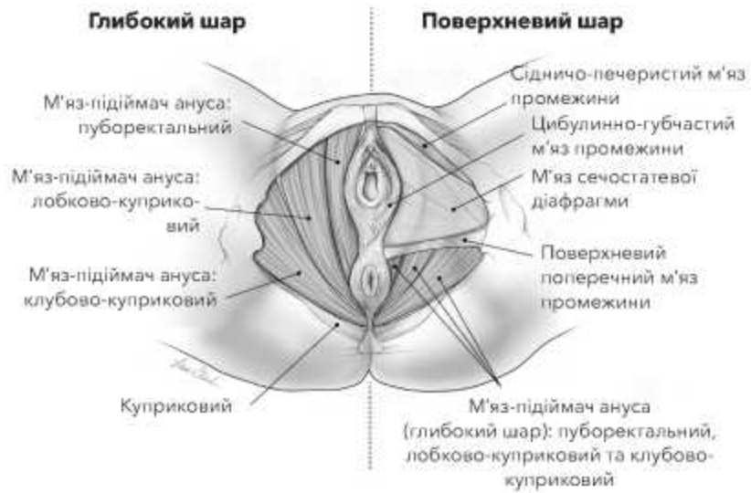
Рис. 3: М'язи тазового дна. Ілюстрація Лізи А. Кларк, Clark Medical Illustration.