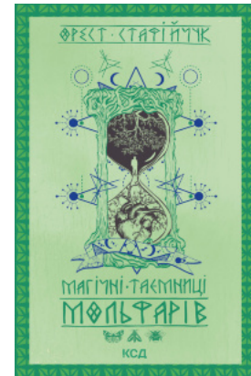
Магічні таємниці мольфарів