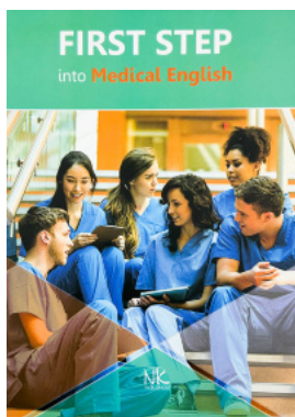
First Step into Medical English