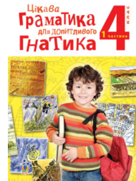
Цікава граматика для допитливого Гнатика: посібник для поглибленого вивчення української мови : 4 кл.: у 2-х ч. Ч. 1