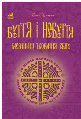
Буття і небуття. Таємниці творення світу