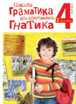
Цікава граматика для допитливого Гнатика: посібник для поглибленого вивчення української мови: 4 кл.: у 2-х ч. Ч.2