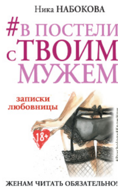
#В постели с твоим мужем. Записки любовницы. Женам читать обязательно!