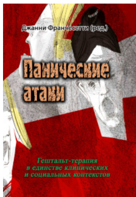
Панические атаки (Гештальт-терапия в единстве клинических и социальных контекстов)