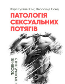
Патологія сексуальних потягів. Посібник з профайлінгу

Перейти до категорії Аналітична психологія